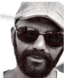
RIAD (06 08 99 26 06) Parole Positive clubados@mairie-saintjean.fr clubados_saintjean31